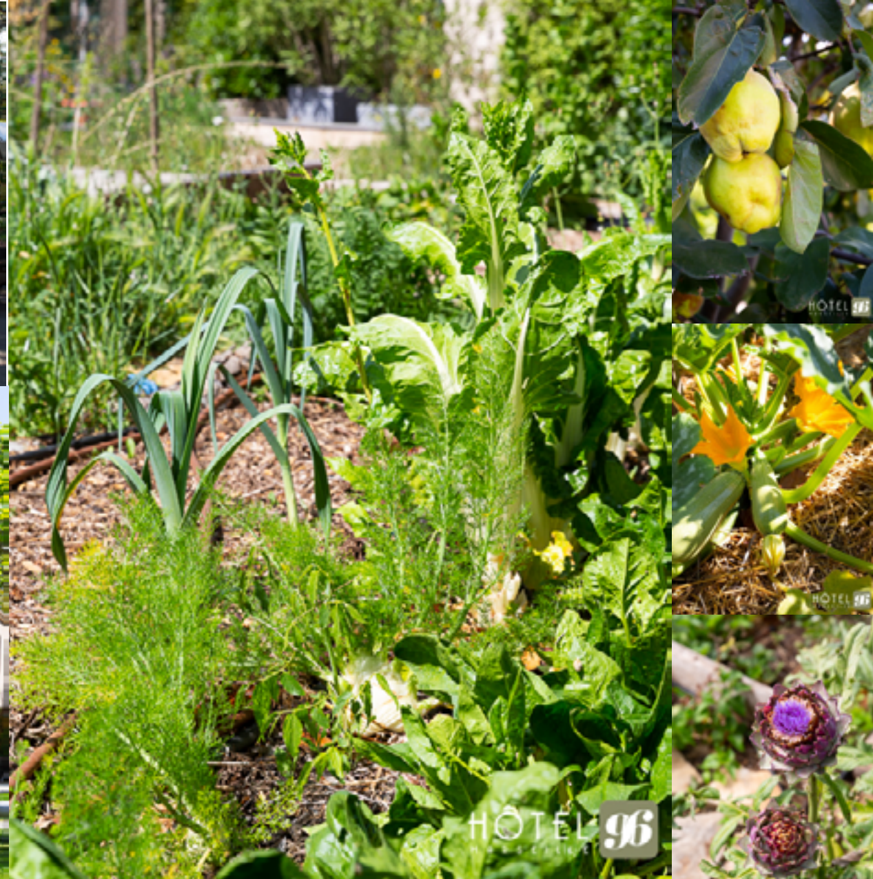
Potager en permaculture pour des fruits et légumes au gré des saisons. Plantes aromatiques fraîchement cueillies dans la Tisanière, pour d'excellentes infusions!