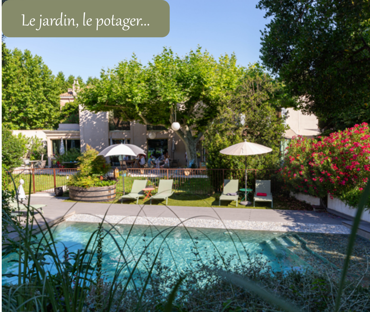
Cadre unique et magique, jardin paysager en plein cœur de Marseille! Chant des cigales et des oiseaux pour une détente en terrasse ou en bord de piscine!